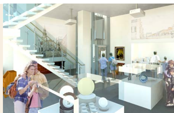
Vue partielle de l'aménagement du Tunnel Gosford lemay associés [architecture, design]

Le Château Ramezay espère marquer l'année du 150 e de la Société en réalisant un projet qui lui est cher et sur lequel il travaille depuis de nombreuses années : l'ouverture au public de l'ancien Tunnel Gosford. Avec l'aménagement de cet espace de près de 1000 m 2 , le Musée pourra offrir des salles spécialement adaptées pour accueillir les groupes et y organiser diverses activités éducatives et culturelles. Les plans prévoient également une salle d'exposition temporaire assurant des conditions ambiantes respectant les plus hautes normes en la matière. L'aménagement d'un espace de conservation de ses collections et archives ayant pour but de les rendre accessibles aux chercheurs est aussi prévu. Faute d'espace, le Musée est contraint de refuser des milliers d'élèves à chaque année. De nombreuses activités ne peuvent avoir lieu pour les mêmes raisons. Afin de répondre à la demande et de poursuivre sa mission de conservation, de diffusion et d'éducation, le Musée espère que les autorités sauront reconnaître l'importance de ce projet et profiter de l'occasion pour soutenir concrètement l'institution dans son développement.