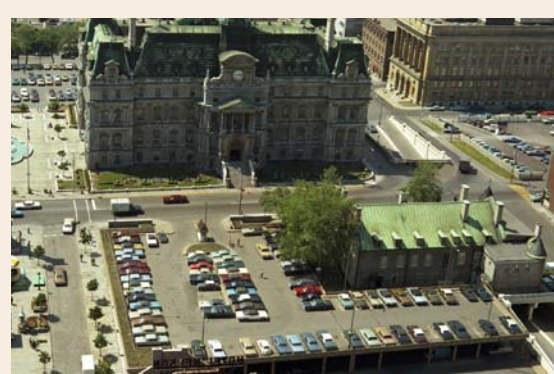
Stationnement étagé, 1956